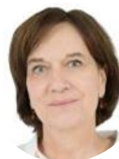
Laurence Rossignol Sénatrice (SER) de l'Oise Rapporteure