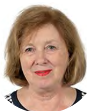
Catherine Deroche Sénatrice (LR) de Maine-et-Loire Présidente

Réunie le mercredi 25 janvier 2023 sous la présidence de Catherine Deroche, la commission des affaires sociales a adopté la proposition de loi modifiée par l'amendement de la rapporteure.